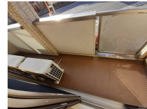
その他部屋・スペース