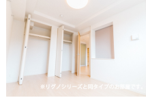
その他部屋・スペース