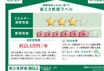
省エネ性能ラベル