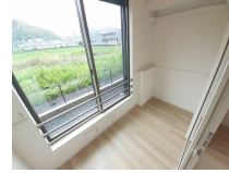
その他部屋・スペース