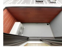
その他部屋・スペース